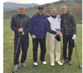
PRONTI In campo al Molino del Pero