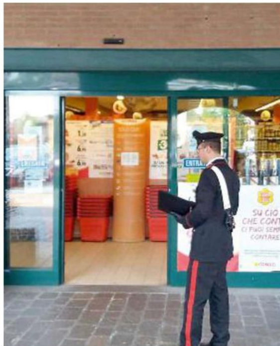
A Monterenzio un 55enne ha cercato di uscire dal supermercato con un bottino di alimentari

A Pianoro le telecamere smascherano il minorenne mentre ruba un borsello