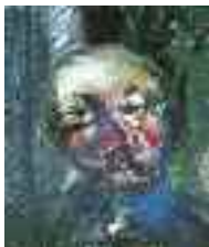
Omaggio a Francis Bacon.